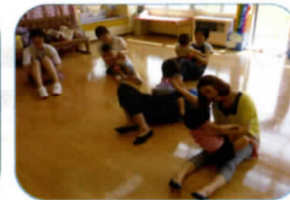
親子ラッコで、ゆ〜らゆ〜ら。