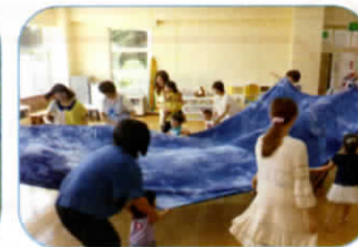
布をバタバタ揺らして、引っ張ったり、もぐったり・・・