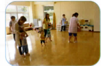
ママの足にのってペンギンさん。