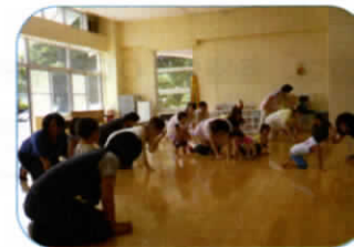
ハイハイ上手だね!