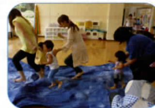
布(海)の上をバシャバシャ。